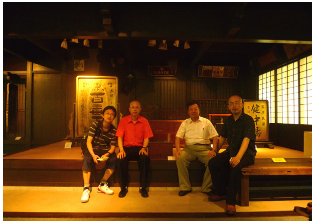
会后安排参观内藤药史博物馆