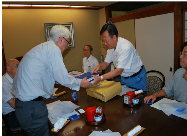
郝近大主委与日本药史学会会长津谷喜一郎先生互赠学术著作