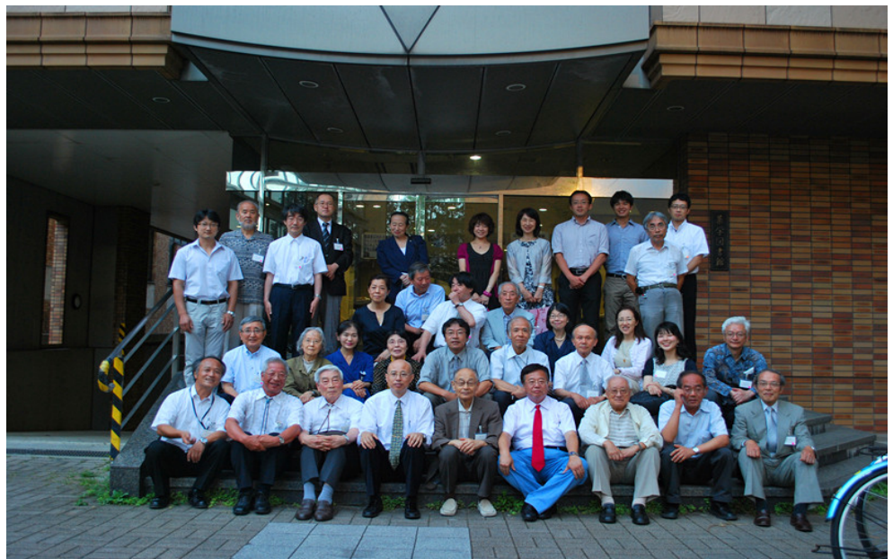
参会人员集体合影