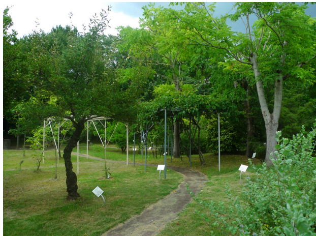
这是内藤药史博物馆的药用植物园